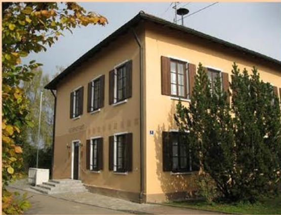
Das damalige Schulgebäude wird heute als Gemeindeamt genutzt, natürlich renoviert!

Für mich ein schlimmer Tag, wohl im September 1946.